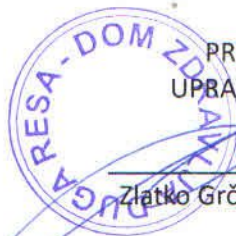
Zlatko Grčić, dipl.ing.prometa